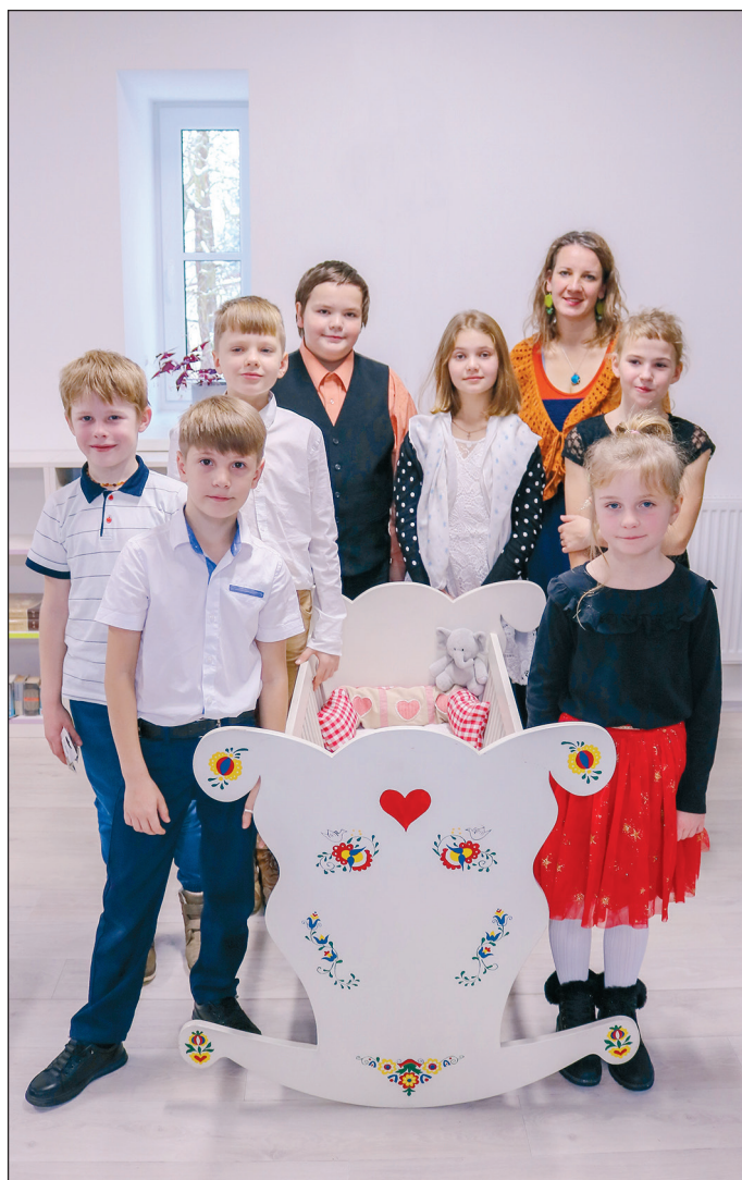
Děti ze ZŠ Nadějkov