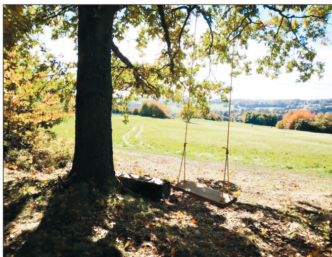
Houpačka a lavička paní hraběnky s výhledem na Nadějkov.