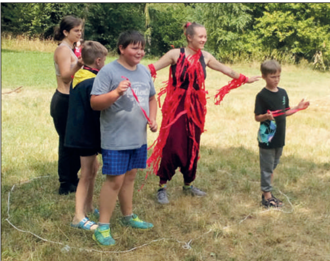
Z pohádky Kouzla králů.