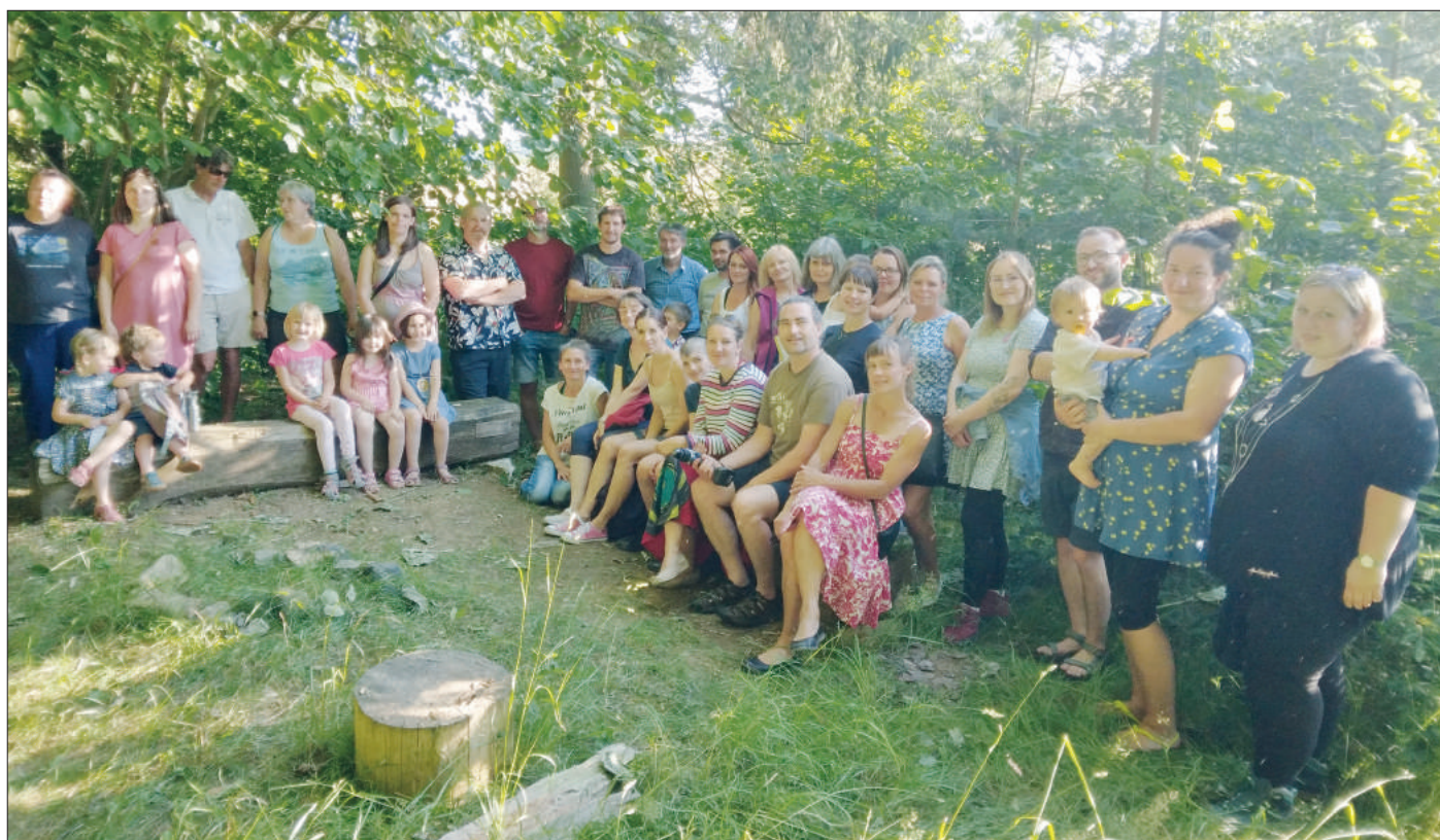
Slavnost u laviček učitelů v Řeháčkovině, 29. června.