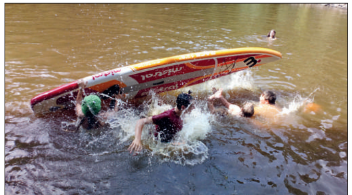
Blbnutí na rybníce.