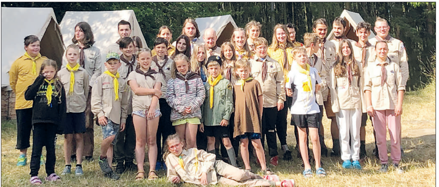
Společná fotka z tábora.