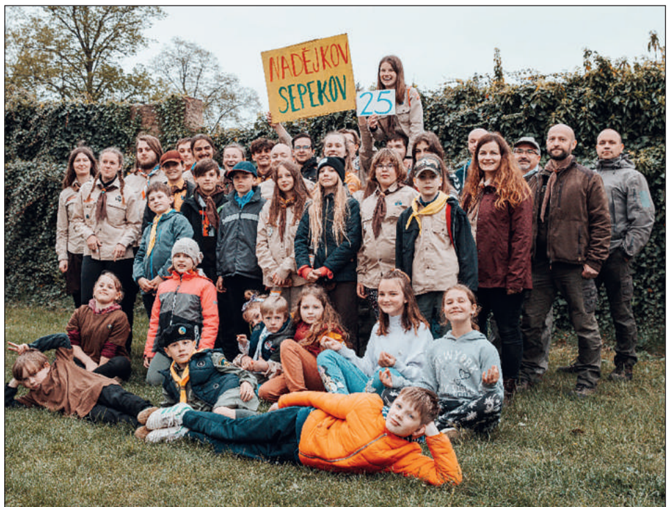
Z oslavy čtvrtstoletí oddílu v Sepekově.