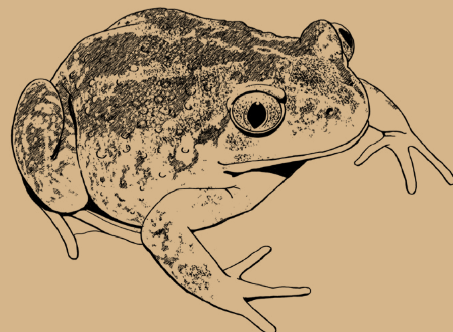
Blatnice skvrnitá (Pelobates fuscus)

Z žab můžeme uslyšet skokana zeleného i hnědého, ropuchu obecnou a vzácně blatnici skvrnitou , noční žábu, která se ve dne zahrabává do země nebo se skrývá pod kameny.