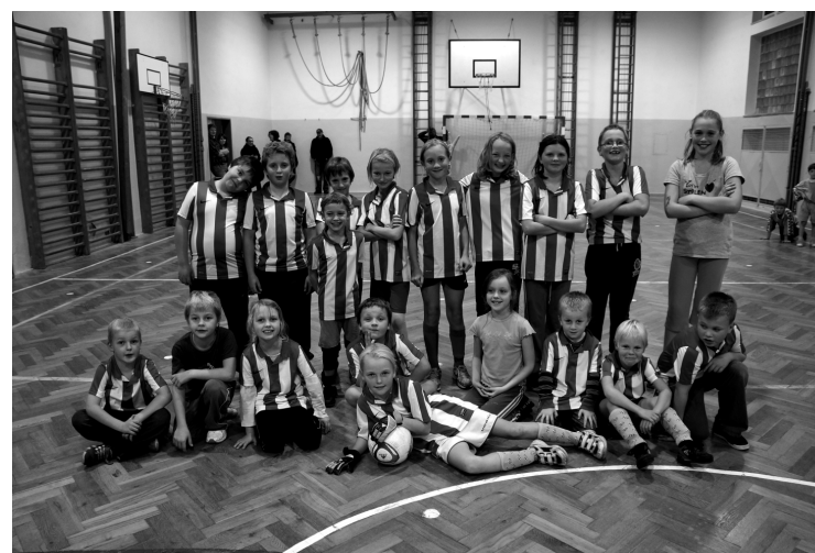
Bílý balet Nadějkov