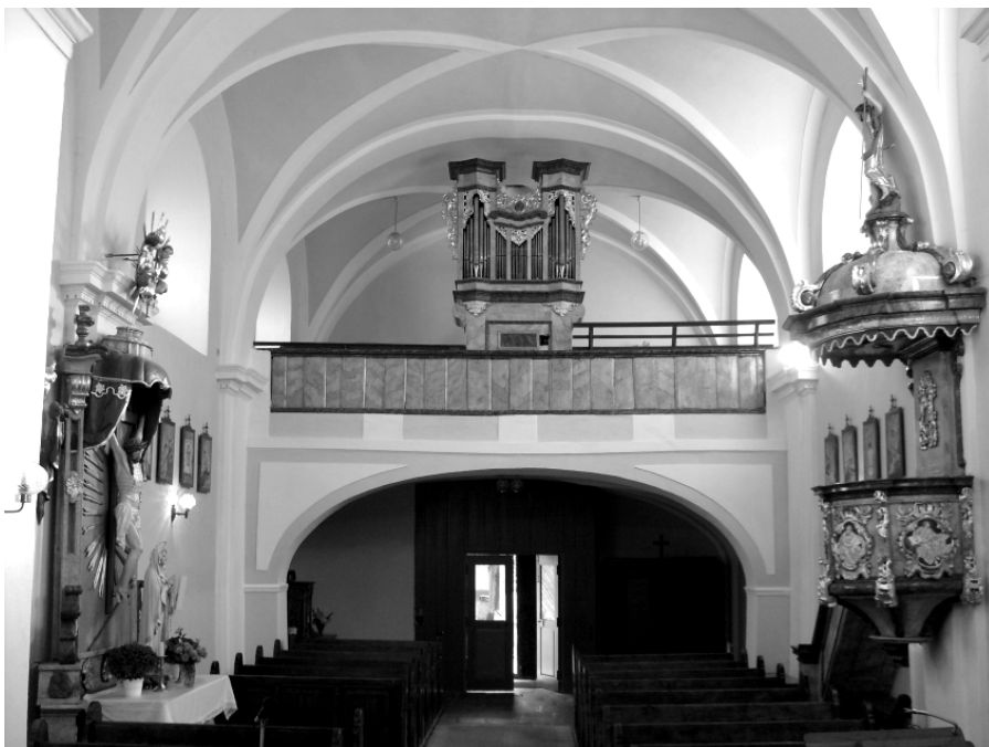
Pohled na nadějkovské varhany

Letos proběhne první etapa restaurování varhan v kostele Nejsvětější Trojice v Nadějkově. Restaurování provede jedna z nejlepších českých varhanních dílen Kánský - Brachtl z Krnova. Pravidelně vám budeme o průběhu restaurování přinášet zprávy, můžete je také sledovat na webu farnosti: nadejkov.milevskoklaster.cz . Dnes malé ohlédnutí do minulosti: