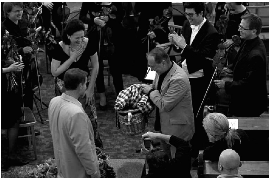
Dojatá pěvkyně přebírá naturální honorář...