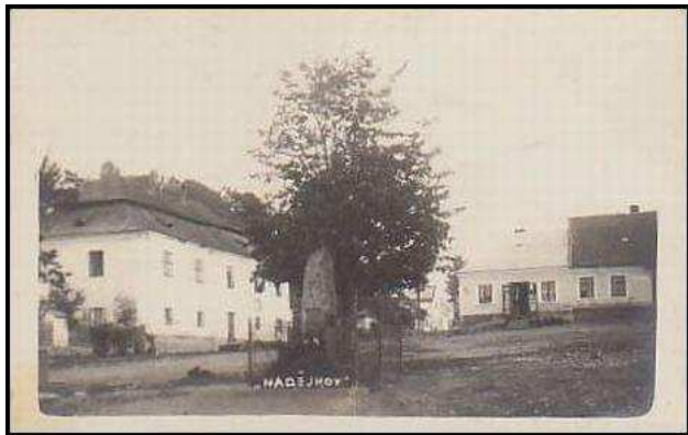
Pomník a lípa v roce 1935