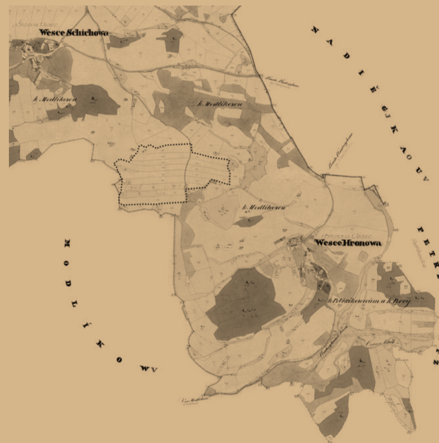
↑ Upravovaná mapa Stablního katastru se zvýrazněním plužin v Sedlištích (mapy vznikaly v letech 1826–1843)

Tuto plužinu můžeme dodnes vidět i na katastrálních mapách a společně s názvem Sedliště může být dokladem dřívějšího osídlení.