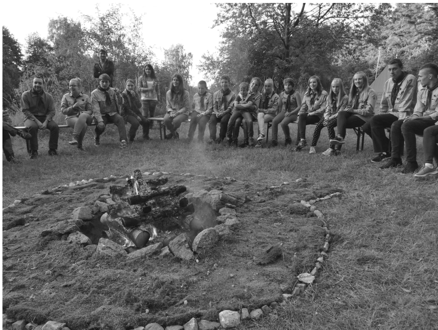
na shledanou se těší Honza a Hád'a Černí

Více informací o skautingu: www.skaut.cz/