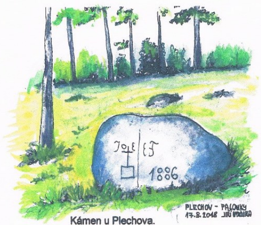
Kámen u Plechova.