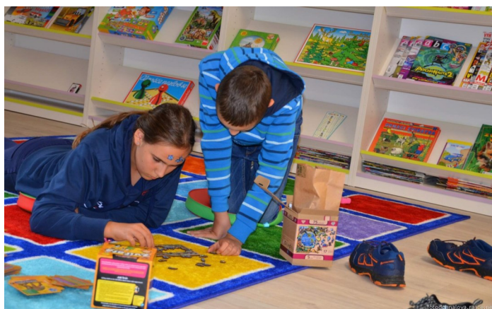
Její součástí je mimo jiné také dětský koutek...