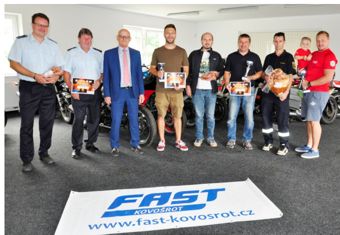
Snímek z vyhlášení letošního ročníku soutěže ve sběru kovového odpadu, která vynesla nadějkovským a petříkovickým hasičům bronzovou pozici.

těšit na Svatomartinský lampionový průvod. Pokud nám to situace dovolí, rádi bychom samozřejmě uspořádali každoroční ples SDH, a to na Boží hod, tedy v sobotu 25. prosince. Termíny akcí v Nadějkově najdete na webových stránkách obce www.nadejkov.cz .