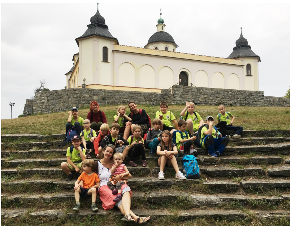
Nadějkovští na vyhlídce u Andělíčka - Kaple Anděla Strážce v Sušici

Příležitost k formování kolektivu a hlubšímu sblížení dal nadějkovským školákům pětidenní ozdravný pobyt v Sušici spojený s plaveckou výukou. „Děti posilovaly svoji samostatnost a mnohé se poprvé ocitly bez rodičů. Čtyřicet hodin denně byly jen s námi učiteli a svými kamarády a spolužáky,“ informuje ředitelka nadějkovské školy. Pobytová akce ve městě, které je nazýváno bránou Šumavy, splnila svůj účel. „Adaptace dětí ve školním kolektivu byla podpořena. Děti měly řadu příležitostí dobře se poznat a skamarádit při hrách,