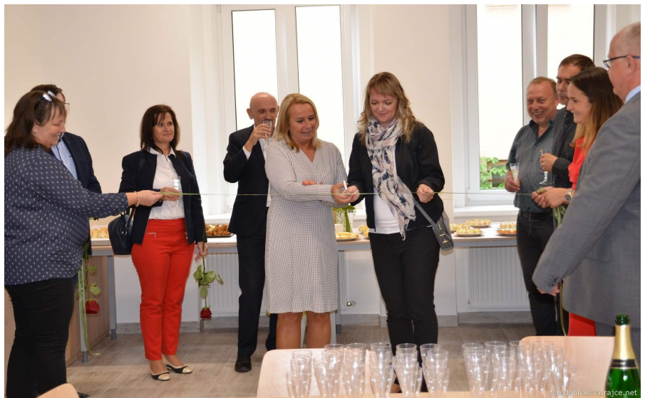
Páska je přestřižena a Polyfunkční komunitní centrum Nadějkov právě vstupuje do života obce. Tak ať jí dobře slouží...!

„Můj dojem z celé té rekonstrukce je skvělý,“ nechal se slyšet David Kozák z místního SDH, jehož členové pomáhali i s organizací slavnostního dne. „Předtím jsem byl v Součkovině jen jednou, ale musím říct, že byla v dezolátním stavu. Prostě barák na spadnutí, který kazil dojem z celého náměstí.“