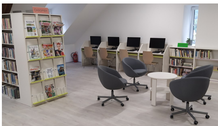
...a počítačový kout s internetem.