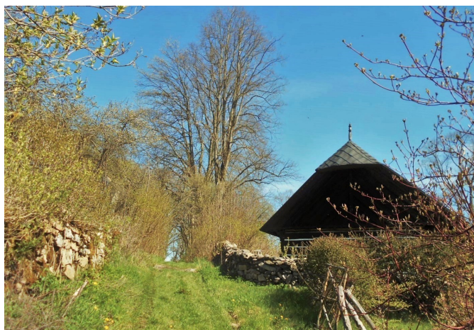
Naučná stezka v Mozolově