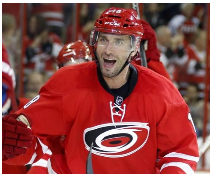
Skvostnou kariéru uzavřel v dresu Caroliny Hurricanes

Víte, tohle by asi bylo na delší povídání. Když půjdu úplně na začátek, vyrůstali jsme v éře, kdy byl sport takový ryzí a spontánní. Dělali jsme ho hlavně kvůli tomu, abychom byli nějakým způsobem zdatní, a hlavně se jím bavili. Celé to dětství jsme v hokeji i v životě prožili bez jakéhokoliv tlaku a nervozity. Všechno, školu i sport, jsme dělali tak nějak z radosti. Spousta lidí má stále nutkání vracet se do minulosti, ale já to nemám rád. Každá doba s sebou něco nesla a co bylo, to se nedá vrátit. Měla svoje benefity anebo taky ne, ale všechno se prostě asi mělo stát tak, jak se stalo. ►►►