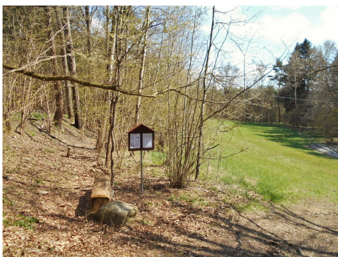
Tabule rodinné stezky a nová lavička v Řeháčkovině

Děkujeme a těšíme se na další spolupráci! Olga Černá, spolek Zachovalý kraj