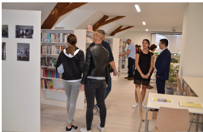
Knihovna sklidila mimořádný obdiv návštěvníků

Ve státních svátcích je knihovna uzavřena.